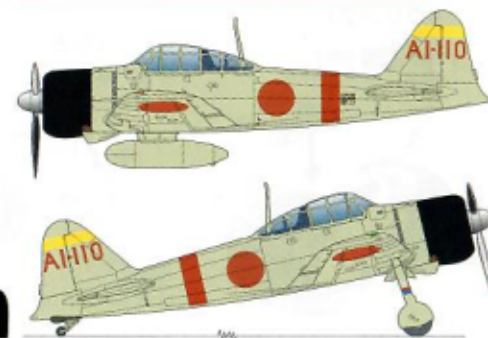
2番機 #2A/C A I-109 丸田 富吉二飛曹 3番機 #3A/C A I-111 佐野 信平一飛兵

2nd wave Fighter Command 3rd section #1 A/C NAP1/C Katumi Tanaka