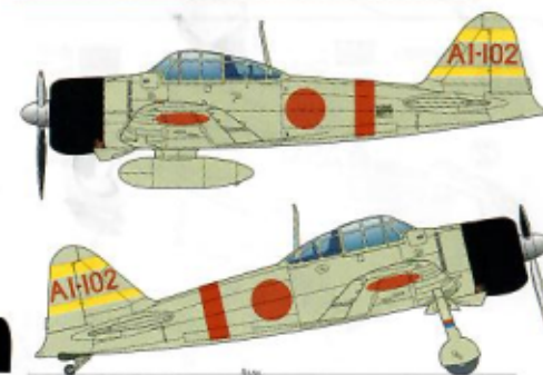
2番機 #2A/C A I-101 木村 権雄一飛曹 (月刊「丸」昭和49年2月号の木村氏の手記には我が零戦はAI-109との記述在り?) 3番機 #3A/C A I-104 井石 清次三飛曹

第1小隊1番機 島崎 三郎大尉 2nd wave Fighter Command 1st section #1 A/C Lt. Saburo Shindo