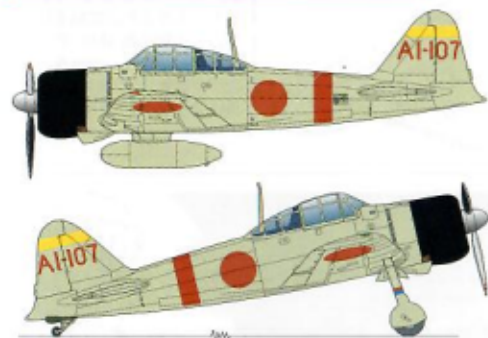
2番機 #2A/C A I-158 谷口 正夫二飛曹 3番機 #3A/C A I-156 高須賀 潤美二飛曹

1st wave Fighter Command 3rd section #1 A/C W.O. Sueyoshi Osanai