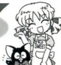
イラスト 藤田 幸久