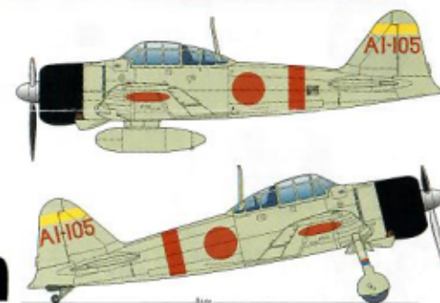
2番機 #2A/C A I-106 高原 重信二飛曹 3番機 #3A/C A I-108 森 栄一飛兵

2nd wave Fighter Command 2nd section #1 A/C NAP1/C Kikue Otokuni